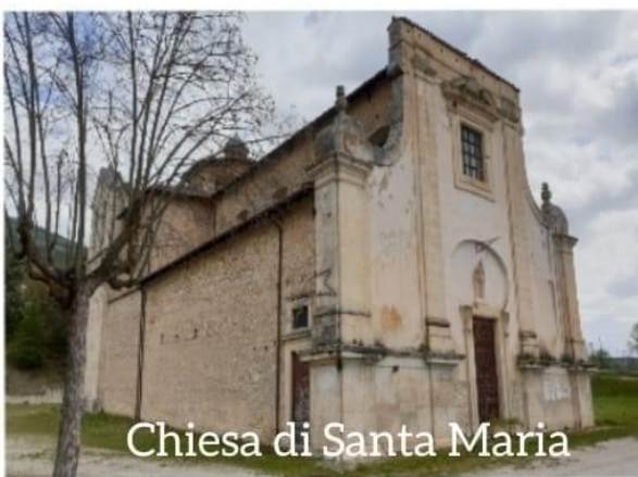
Chiesa di Santa Maria