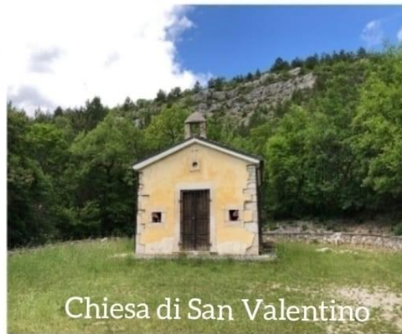
Chiesa di San Valentino