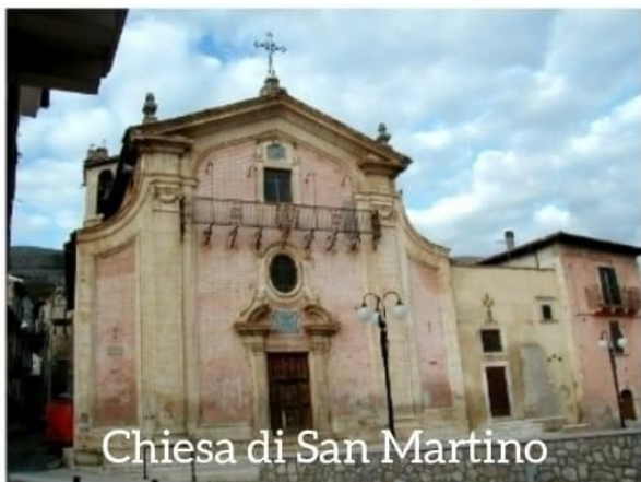
Chiesa di San Martino