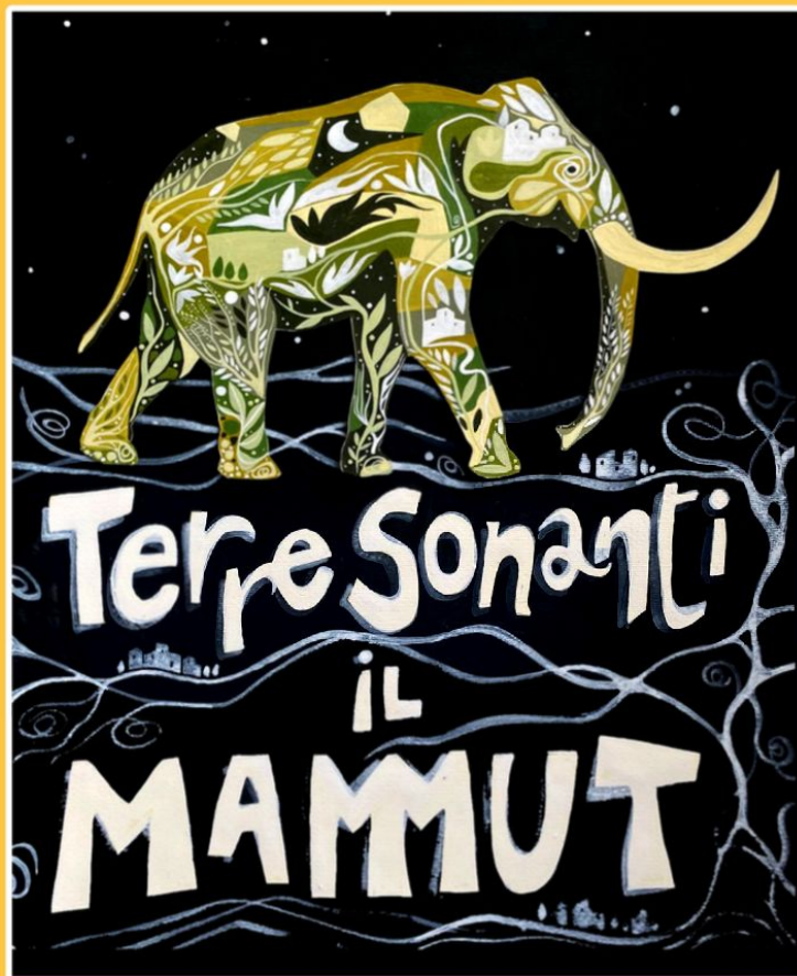
Disegno locandina: Massimo Piunti

5 OTTOBRE 2024 ORE 18 - PIAZZA DEL MERCATO BARISCIANO (AQ)